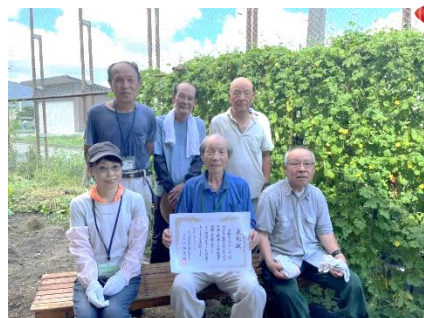
京都府社会福祉協議会会長表彰受賞！ 学校ボランティアの会

令和6年9月10日（火）京都テルサにて、第73回京都府社会福祉大会が開催されました。ボランティアセンター登録団体より、「学校ボランティアの会」が京都府社協会長表彰を受賞されました。