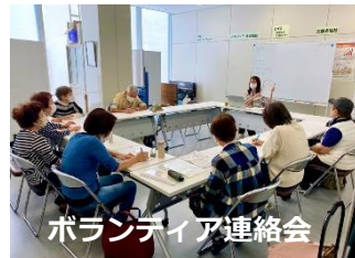
ボランティア連絡会

月1回開催しているボランティア連絡会では、市内のボランティア振興のため、団体相互の連携を深め、情報交換などを行っています。今年度は「地域課題を解決するつながりづくり」をテーマに、地域で気になることを出し合い、活動で何ができるのか、の協議を行っています。視点を地域に向けて意識し、連絡会を運営しています。