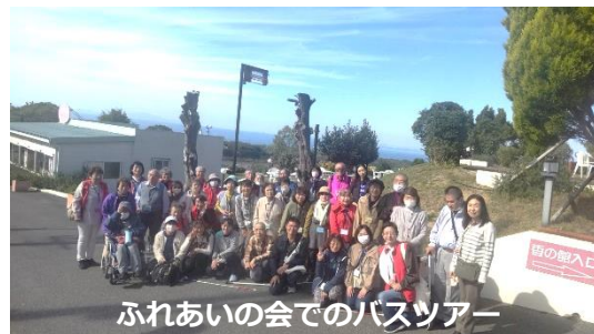
ふれあいの会でのバスツアー