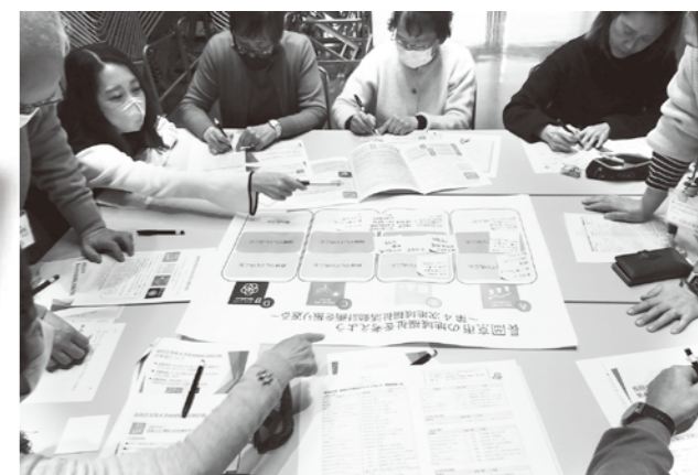
地域福祉活動者 住民懇談会の様子