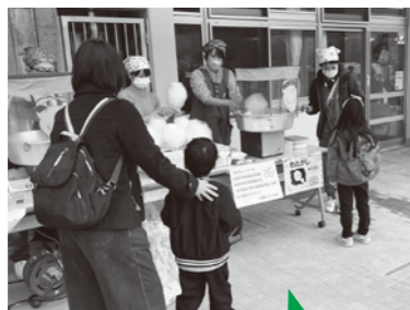
施設利用者さんが作った募金箱

(福)和楽会保育・高齢複合施設友岡より地域とつながれる機会について相談があり、きっかけとして長四フェスティバルの赤い羽根共同募金(わたがし出店)への参画を提案、コーディネート。利用者さんも募金箱作りなど役割をもち参加しました。施設も地域の一員であり、今後も多様な方々がつながれる工夫を考えていきます。