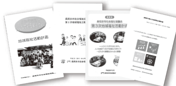
これまでの地域福祉活動計画

長岡京市社協では令和7年度に、第5次地域福祉活動計画の策定をします。そこで市民の皆様から「こんな長岡京市にしたい」「こんな事に困っている」などご意見を頂戴し、解決方法をみんなで考えるために住民懇談会を開催いたします。 ※時間は全日程 午前10時~11時30分