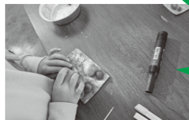
好きな飾りつけをしたよ