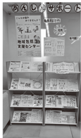
多世代への情報提供