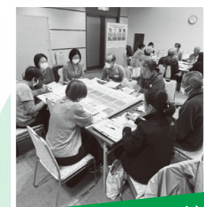
二中校区(三小、七小、十小)