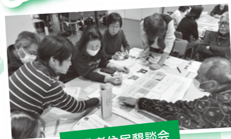
活動者住民懇談会