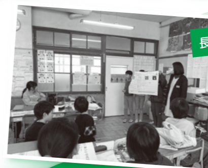
長岡第三小学校四年生