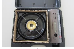
カセットガスコンロ