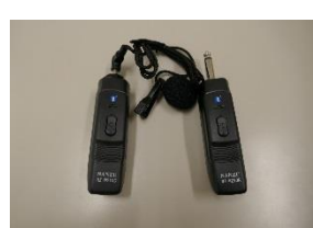
ワイヤレスマイク