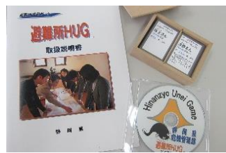
避難所運営ゲーム