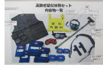
高齢者擬似体験セット