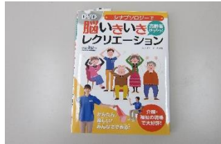
レクレーション本