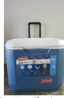
クーラーボックス