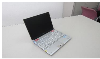
プロジェクター用パソコン