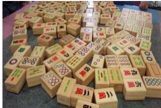
コミュニケーションマージャン