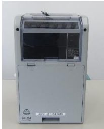
ワイヤレスアンプ