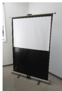
スクリーン(大・小)