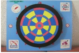
ウェルネスダーツ