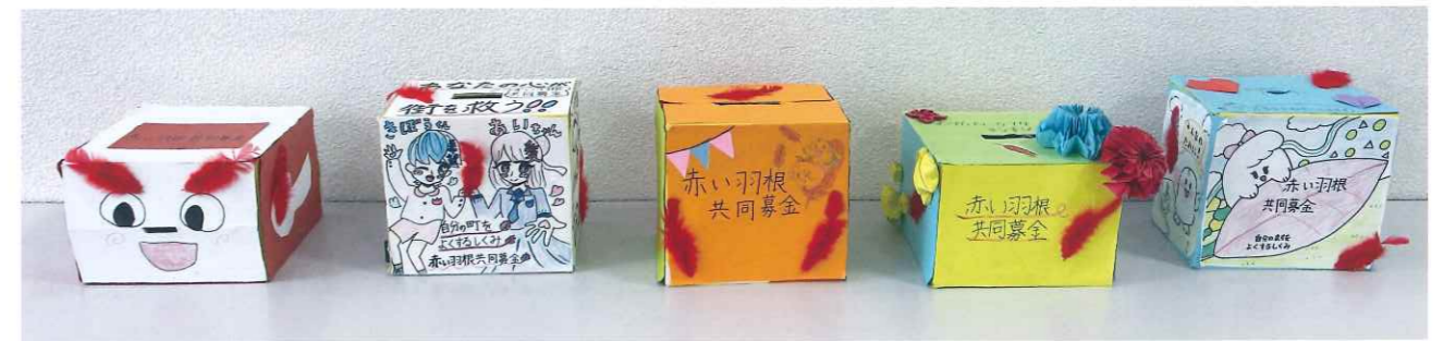
手作り募金箱を設置しました!

環境委員会の皆さんが取り組みました。共同募金のマスコット「愛ちゃんと希望くん」を丁寧に描き、募金の思いが伝わるような募金箱です。添えられたメッセージには、自分たちの町を元気にしたいという願いと、地域の方々への温かい思いが込められています。