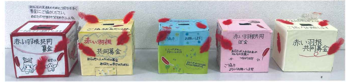
手作り募金箱を設置しました!

4年生の皆さんが福祉教育の一環で取り組みました。町のために「自分たちにできること」を考え、その思いを大切に、クラスで協力しながら作成しました。一つひとつの募金箱に添えられたメッセージは募金委員会へ託され地域のお店に設置されました。