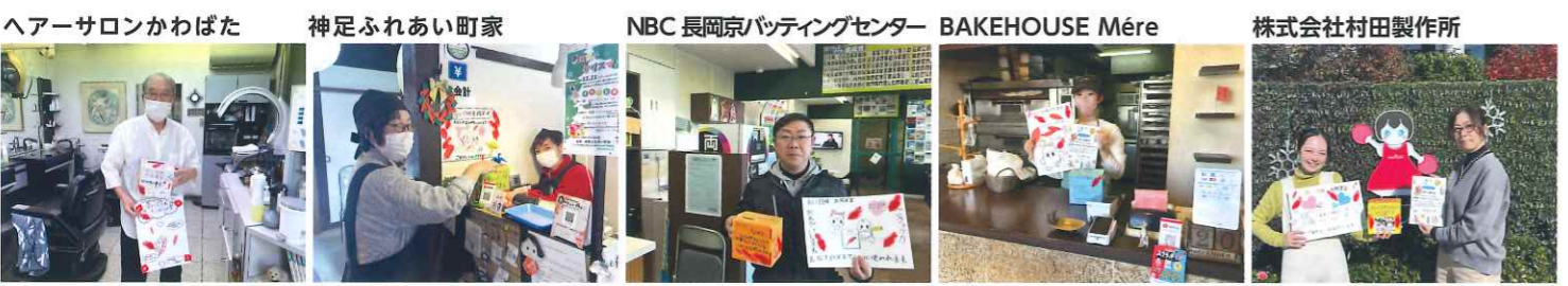
ヘアサロンかわばた 神足ふれあい町家 NBC 長岡京バッティングセンター BAKEHOUSE Mére 株式会社村田製作所