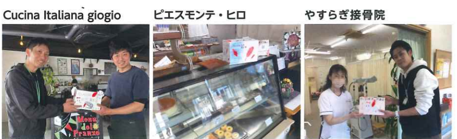
Cucina Italiana gioiolo ピエスモンテ・ヒロ やすらぎ接骨院