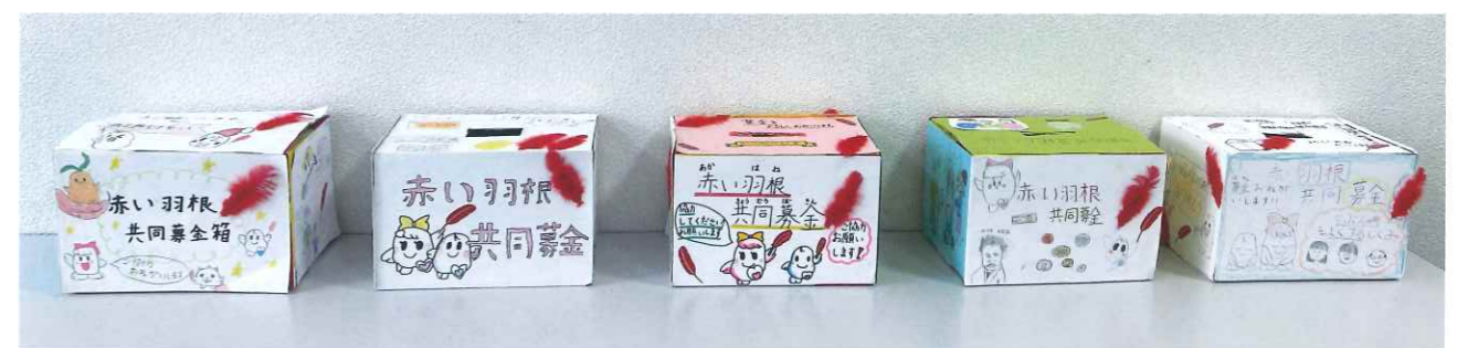
手作り募金箱を設置しました!

4年生の皆さんが、日頃から温かく見守ってくださっている地域のお店や場所への感謝を込めて作成しました。町を良くしたい、盛り上げたいという熱い思いが、一つひとつの募金箱と力強いメッセージにしっかりと込められています。