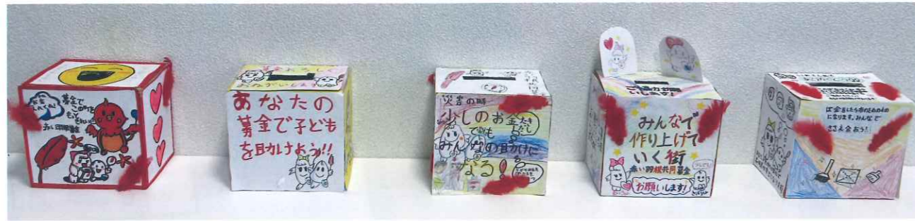
手作り募金箱を設置しました!

今年から4年生が取り組みを担当することになりました。共同募金の思いを受け止めて制作された募金箱には、地域を思う熱いメッセージが込められており、子どもたちの熱意がしっかり形になった素晴らしい募金箱になりました。