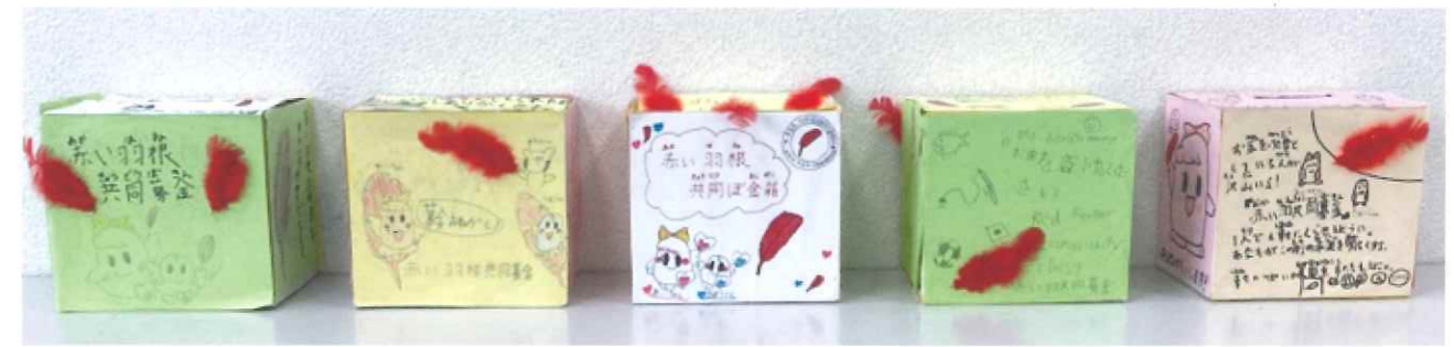
手作り募金箱を設置しました!

4年生の皆さんが協力しながら作成しました。共同募金を「自分たちのこと」として捉え、地域への温かい思いが込められた募金箱になりました。募金箱の回収を4年生が笑顔で見送ってくれました。