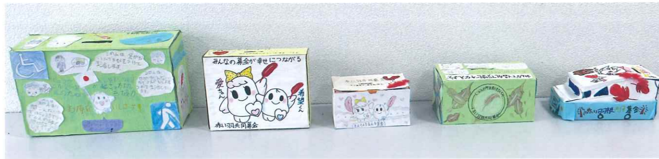
手作り募金箱を設置しました!

4年生5クラスの皆さんが、共同募金の思いを大切に受け止め、募金箱作りに取り組みました。心を込めて作られた募金箱は、地域の方々との温かい「架け橋」となり、一つひとつのメッセージにはみんなの思いがぎゅっと詰まっています。