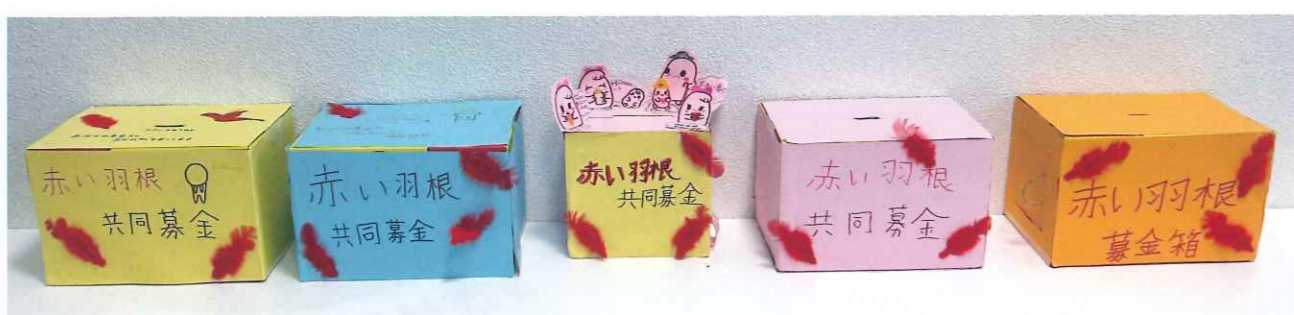
手作り募金箱を設置しました!

児童会の皆さんが取り組みました。校内放送で協力者を募り、みんなで作成しました。そうして作り上げられた募金箱に添えられた温かいメッセージは、地域の方々との絆を感じさせてくれる、心のこもったものになりました。