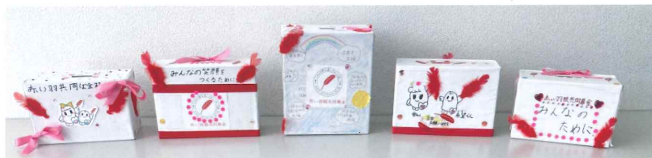
手作り募金箱を設置しました!

図書委員会の皆さんが取り組みました。委員会の活動を通じて培った丁寧な思いを込めて、一つひとつの募金箱を作成しました。添えられた温かいメッセージには、地域の方々への感謝と「町を笑顔にしたい」という優しい願いが込められています。