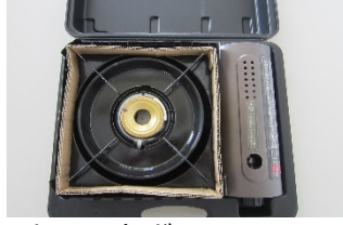
カセットガスコンロ