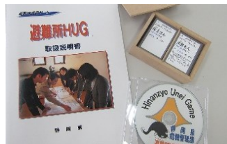
避難所運営ゲーム