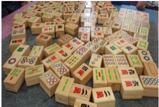
コミュニケーションマージャン