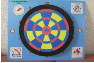
ウェルネスダーツ