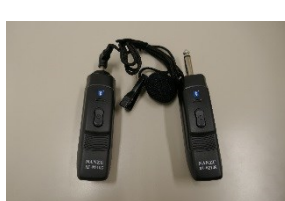
ワイヤレスマイク