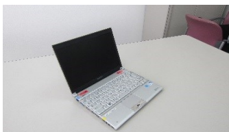
プロジェクター用パソコン