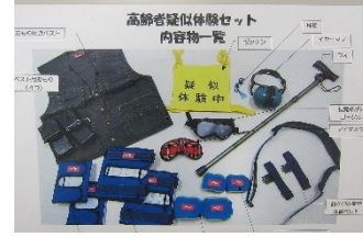
高齢者擬似体験セット