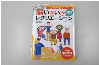
レクレーション本