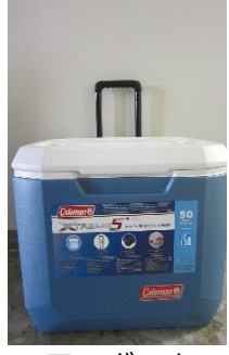
クーラーボックス