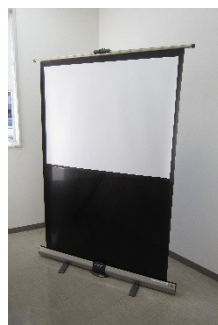
スクリーン(大・小)