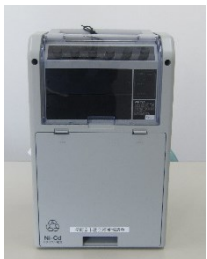
ワイヤレスアンプ